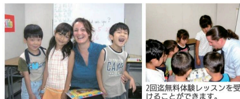
2回無料体験レッスンを受けることができます。